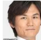
南原さん 「おもしろいねえ」と まあまあうけた

私の返しがよかったのかはわかりませんが、スベらずに済んでよかったです。えらい冷や汗をかきましたが、良い思い出です。