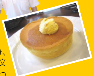
▲星乃珈琲の 話題のパンケーキ